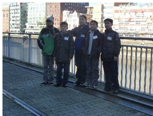
Kleine Fotopause am Zollhafen

Weiter ist ein fußläufiger Abstecher zum Gebäudekomplex des NRW-Landtages und zu den spektakulären Bauten des WDR am Zollhafen ein Muss. Die Bauten sind ein besonders begehrtes Fotomotiv. Jeder zückt seine Digicam.