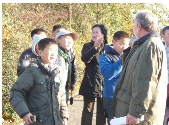
Start zur "Rhein-Knie-Erforschung"

Der Tag steht im Zeichen der „Rhein-Knie-Erforschung“. Befindet sich doch die Jugendherberge, die nach Bauart, Ambiente und Angeboten eher einem Gästehaus gleicht, neben der Rheinkniebrücke in Düsseldorf-Oberkassel (für Ortsunkundige: linksrheinisch).