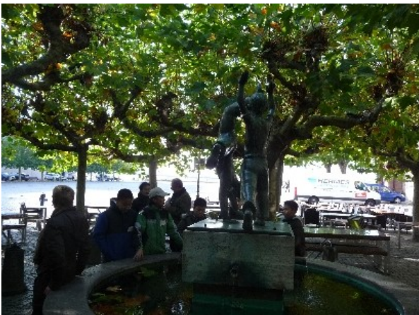
Kleine Diskussion am Radschläger-Brunnen

Weiter streben wir zur „Kö“ mit ihren auffallenden Galerien und Geschäften. Die Frage, ob bei uns alle Stiefel 700 Euro kosten, kann verneint werden. Der gläserne Aufzug des Sevens bereitet den Jungen sichtlich viel Spaß, und sie probieren das „Auf und Ab“. Auch die Pralinen eines bekannten Schokoladenspezialisten werden probiert und für ausgezeichnet befunden.