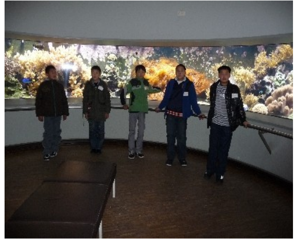
Müde vor dem Panorama-Aquarium

Der erfahrungsreiche Tag wird dann feucht- fröhlich bzw. mit Kickerfußball der Jungen beschlossen. Zum Anpassen an die veränderte Ortszeit ist eine frühe Bettruhe angesagt.