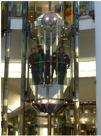
Der Aufzug ist sehr beliebt.

ist er nicht möglich, weil der Fluss dort im Sommer versiegt.