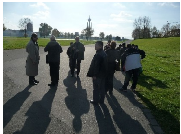
Auf der Festtagswiese

Der Tritonenbrunnen, das Carschhaus, mit seiner interessanten Geschichte wie auch Bauart im Detail, das Rathaus, das Jan-Wellem-Denkmal, der Schlossturm, der Radschläger-Brunnen, bei dem einer der mongolischen Jungen erklärt, dass auch er Rad-Schlagen kann, die Lambertusbasilika, das Stadterhebungsmonument an der nördlichen Düssel, die Tonhalle, sind nur einige Stationen, bevor es zurück zum Quartier geht mit der U75 über die Oberkasseler Brücke, dann zu Fuß über die Festwiese rheinaufwärts. Zeit zum Mittagessen.