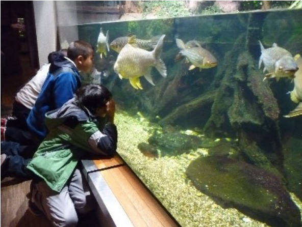
Fluss- und Meeresgetier sind für unsere Gäste spannend..

Anschließend fahren wir in Richtung Aqua- ZOO.