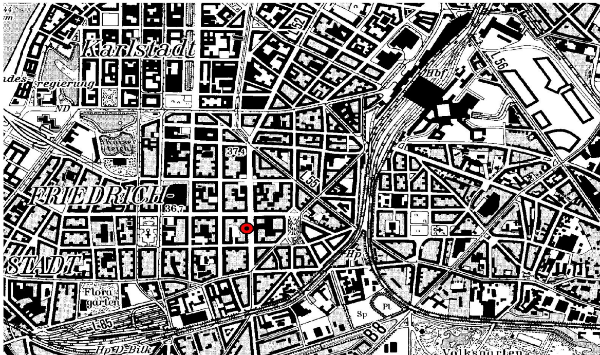
Abbildung 2.2/2: Lage der Messstation in der Corneliusstraße in Düsseldorf.