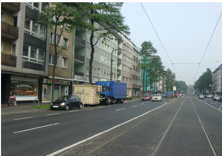
Abbildung 2.2/1: Bild der Messstation in der Corneliusstraße in Düsseldorf

Der Probeneinlass für die PM 10 -Messung befindet sich in einer Höhe von 3,5 m. Die PM 10 -Konzentrationen wurden kontinuierlich bestimmt. Die Verfügbarkeit dieser Daten lag bei 95 %. Zudem wurden an insgesamt 95 Tagen gravimetrische Messungen mit einem diskontinuierlichen Referenzverfahren gemacht, um einen Korrekturfaktor für die kontinuierlich ermittelten Daten zu bestimmen.