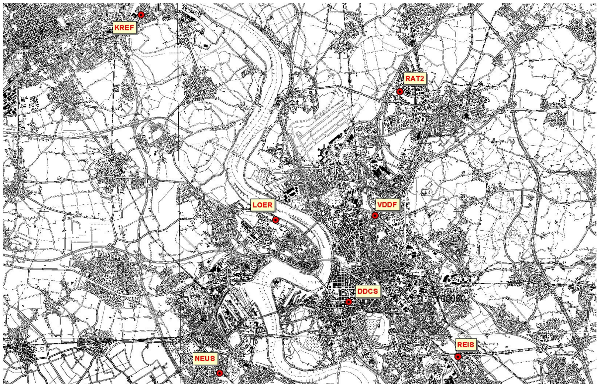
Abbildung 3.1/1: Lage der Messstation im Umfeld von Düsseldorf.

Im Umfeld von Düsseldorf werden an insgesamt fünf Stationen die Konzentrationen von PM 10 erfasst. Diese Stationen können für die Abschätzung des Gesamt-Hintergrundniveaus herangezogen werden. Die nachfolgende Karte gibt einen Überblick über die Lage dieser Stationen. Die Station in der Corneliusstraße in Düsseldorf hat das Kürzel DDCS.