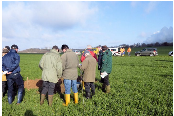
Abb. 1 Musterstück für die Wertermittlung Abb. 2 Bei der Wertermittlung 1

Im Frühjahr 2019 ist in Zusammenarbeit mit der Finanzverwaltung der Abschluss der Neulandschätzung durchgeführt worden. Zurzeit werden aus den Ergebnissen der Luftbildauswertung die Zuteilungsblöcke bestimmt. Im Anschluss werden die Ergebnisse der Neulandschätzung darin eingearbeitet und die Wertermittlung daraus abgeleitet. Die Bekanntgabe der Wertermittlung erfolgt voraussichtlich 2024.