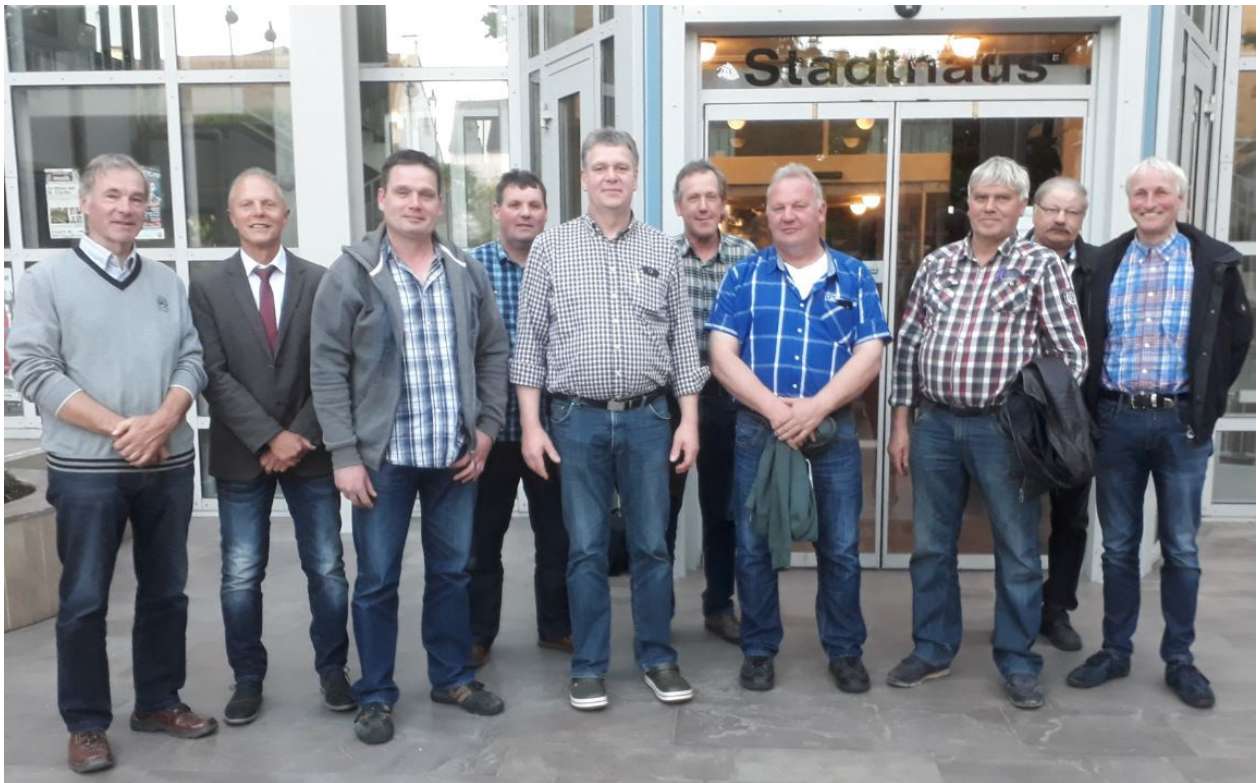
Abb. 1: Vorstand und Stellvertreter der Teilnehmergeinschaft Wallach-Borth 1