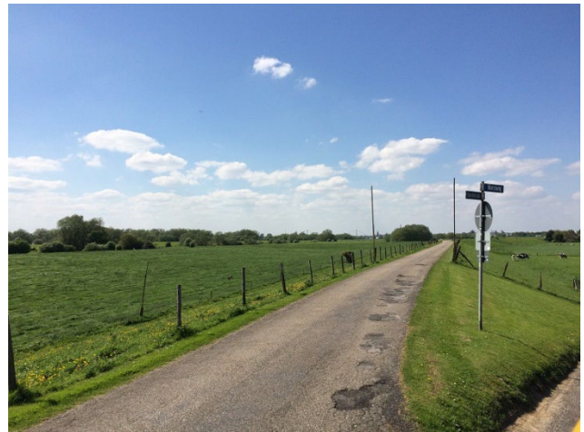
Abb. 1: Blick ins Deichvorland

Im Zuge der Deichbaumaßnahme werden die an dem alten Deich, der sich größtenteils im Eigentum des Deichverbandes Bislich-Landesgrenze befindet, vorhandenen Mängel – wie fehlende Standsicherheit, unzureichende Ausbauhöhe und fehlende Möglichkeiten der Deichverteidigung – behoben. Dies soll insbesondere durch die Verbreiterung und Erhöhung des Deiches sowie die Anlegung von Deichverteidigungswegen erreicht werden.