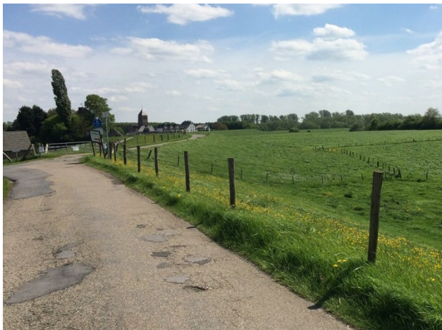
Abb. 2: Deich am Ortsrand von Dornick

Nach Einleitung des Flurbereinigungsverfahrens am 14. November 2016 ist im September 2018 die Wahl des Vorstandes der Teilnehmergeinschaft, der während des gesamten Verfahrens die gemeinschaftlichen Interessen der Teilnehmergeinschaft wahrnimmt, erfolgt.