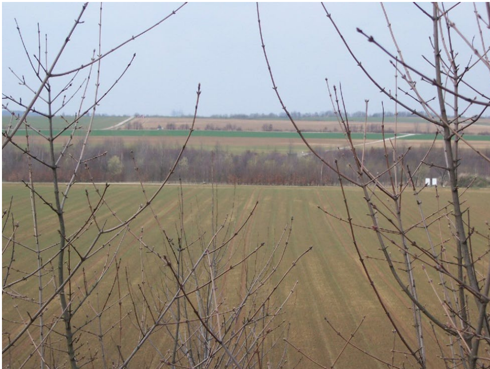
Abb. 1: Blick über das neue Elsbachtal 1

Der Flurbereinigungsplan wurde im Frühjahr 2022 vorgelegt. Es wurde keine Widersprüche eingelegt. Die Ausführungsanordnung mit Wirkung zum 01.04.2023 wird zurzeit öffentlich bekanntgemacht. Das bedeutet, dass zu diesem Datum das neue Kataster und das neue Eigentum gelten. Grundbücher und Katasternachweise werden dem Flurbereinigungsplan entsprechend berichtigt.