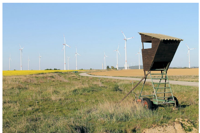
Abb. 2: Rekultivierte Landschaft

Die Vorlage des Flurbereinigungsplans ist für Ende 2024 vorgesehen.