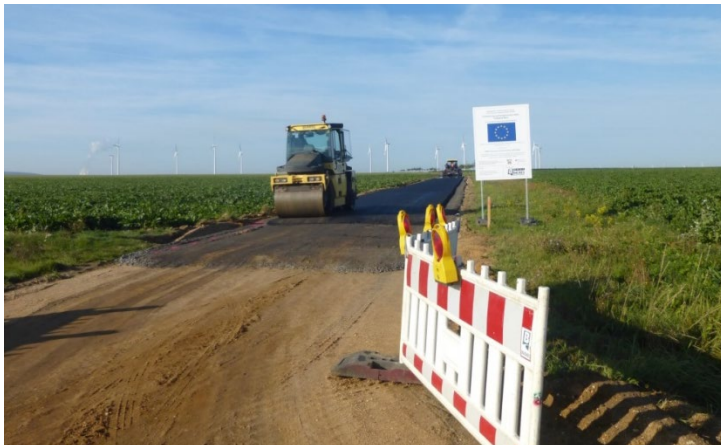
Abb. 1: Wegebau 2017

Das ursprüngliche Verfahrensgebiet der Flurbereinigung Königshovener Höhe wurde 2011 erheblich erweitert. Durch den Teilungsbeschluss wurde das Verfahren im Mai 2013 in die Teilgebiete Königshovener Höhe – Teilgebiet Ost und Königshovener Höhe – Teilgebiet West geteilt, um eine zeitlich unabhängige Bearbeitung der beiden Teilgebiete zu ermöglichen.