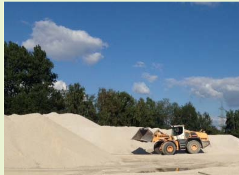
Kiesgewinnung am Niederrhein

Mindestens 25 Jahre Versorgungszeitraum für Lockergesteine