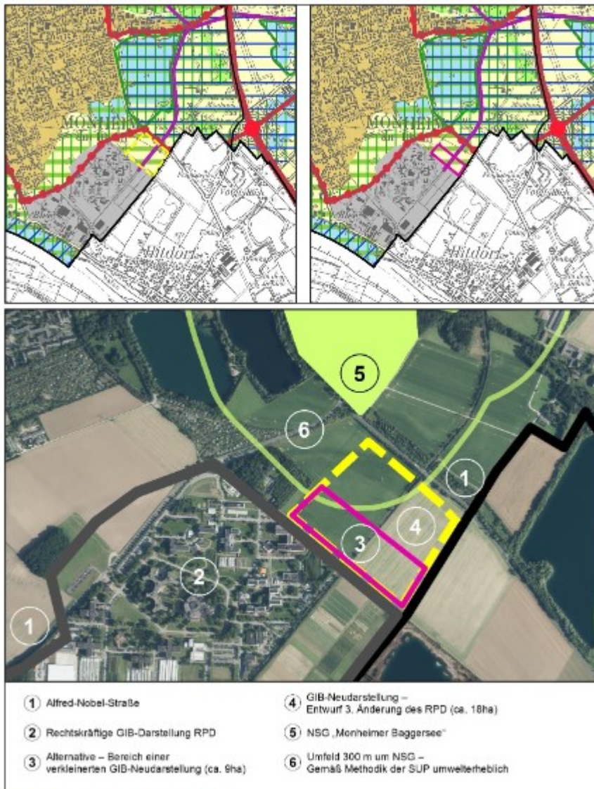
Abbildung 3: Alternativenprüfung @brd Links oben: Geplante Festlegung über rechtskräftigem Regionalplan Rechts oben: Alternative Festlegung über rechtskräftigem Regionalplan Unten: Detailbetrachtung mit Luftbild

Der in Vorlage beigefügte Umweltbericht erörtert als verbleibende Variante einen veränderten Zuschnitt des auszuweisenden Gebietes: Es könnte erwogen werden, die regionalplanerische Festlegung im östlichen Bereich zu verkleinern“. Dies würde die Distanz zum angrenzenden Naturschutzgebiet erhöhen und ließe mehr Raum für den von Osten kommenden Kaltluftvolumenstrom in seiner Bedeutung für den Luftaustausch im Bereich der südlichen Hauptortlage.