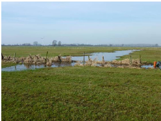
Auswirkung des Probestaues im Graben W45 in die benachbarten Projektflächen hinein.

Übersicht über die Naturschutzflächen (Stand 1.12.2012) vor Erstellung des Flurbereinigungsplanes.