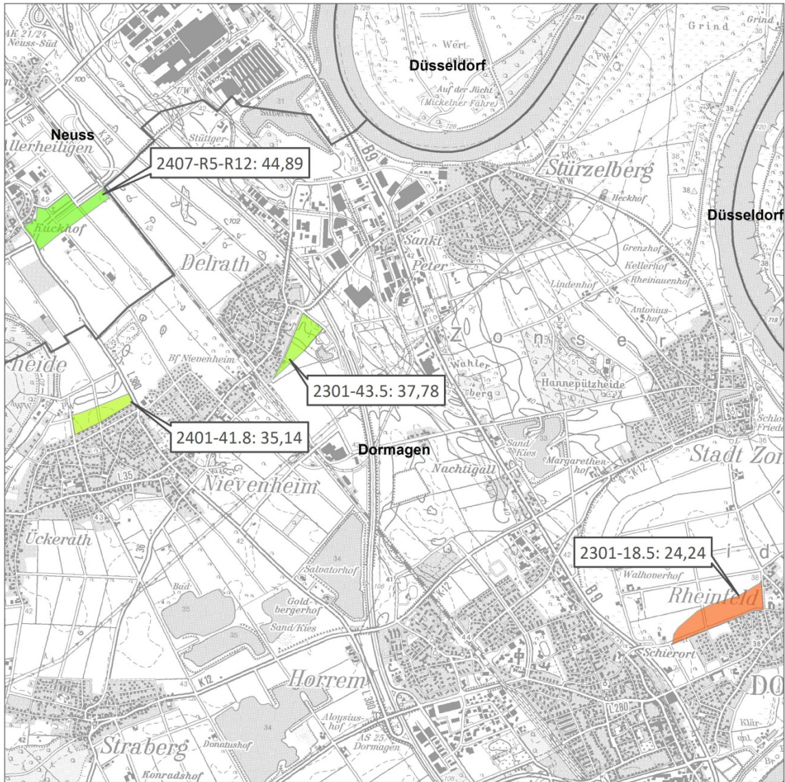
Abb. 7.1.1.6.1.3j: Geprüfte Flächen in Neuss und Dormagen